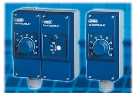
Термостаты JUMO heat THERM